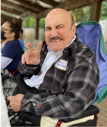
Me voici en train de faire le signe V-pour-la victoire a la réunion du 50eme anniversaire de l’Église La Porte Ouverte!

En ce temps de Noël, je prie : “Seigneur, qu’il en soit ainsi. ” Et puissiez-vous passer un merveilleux moment en célébrant le don indicible de Dieu (II Corinthiens 9.15) qui a envoyé son Fils pour naître et mourir pour nous !